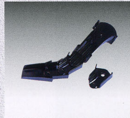
関節の追加延長も可 (最高2個まで)