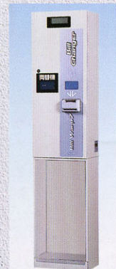
簡易リサイクル両替機