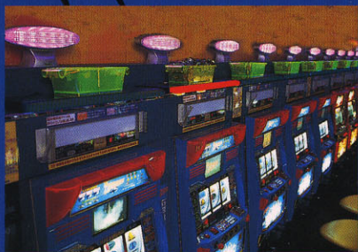
1 通常は全消灯。メダルの入った箱を置いた台のみ点灯