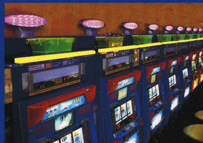
3 メダルの有無に関わらず同一パターンで点灯。