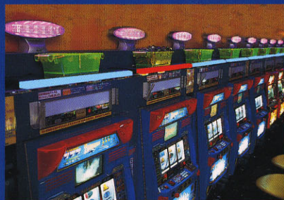
2 一列全て同パターンで点灯、メダルの入った箱を置いた台のみ別パターンにて点灯。