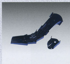
関節の追加延長も可 (最高2個まで)